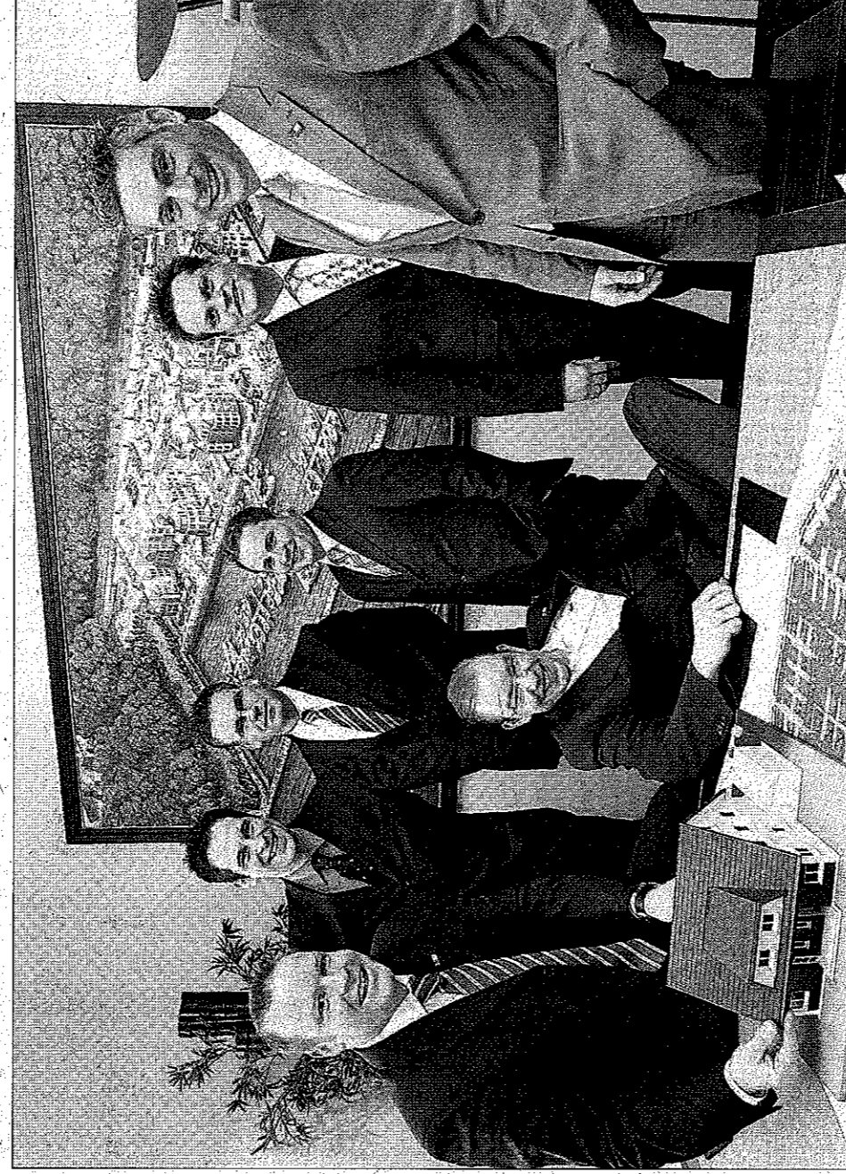
Das Team von beta-Eigenheim in Bergkamen hat ein ehrgeiziges Projekt in Holzwickede auf die Beine gestellt. Die Vermarktung der energiesparenden Häuser hat begonnen.

Neue Caroline? Worum geht es da? „Das war früher eine Schachanlage und ein Eisenwerk. Die Gemeinde Holzwickede hat den Bereich komplett saniert und für die Bebauung nutzbar gemacht“, berichtet Salewski. 150 neue Einfamilienhäuser entstehen dort, ein Drittel ist bereits verkauft.